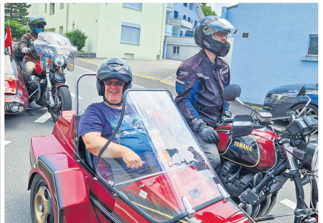
Am vergangenen Samstag fand der jährliche Töffausflug für die Bewohnerinnen und Bewohner der BSZ Stiftung statt.

Die ersten Kinder sind bereits wieder aus dem Sommerlager heimgekehrt, so die Teilnehmer des Blauring-Lagers und die Wölfe der Pfadi St. Meinrad Einsiedeln und der Pfadi Rothenthurm . Eigentlich sollte heute im Einsiedler Anzeiger der erste Lagerbericht der Einsiedler und Rothenturmer Pfadler erscheinen. Leider ging dies bei den Einsiedlern vergessen . Bei so vielen Abenteuern, welche die jungen Pfadfinder erleben, kann man dies auch verstehen. Wir hoffen nun, dass wir in der kommenden Ausgabe einen Blick ins Pfadi-Sommer-Lager in Klosters erhaschen können./lsc.